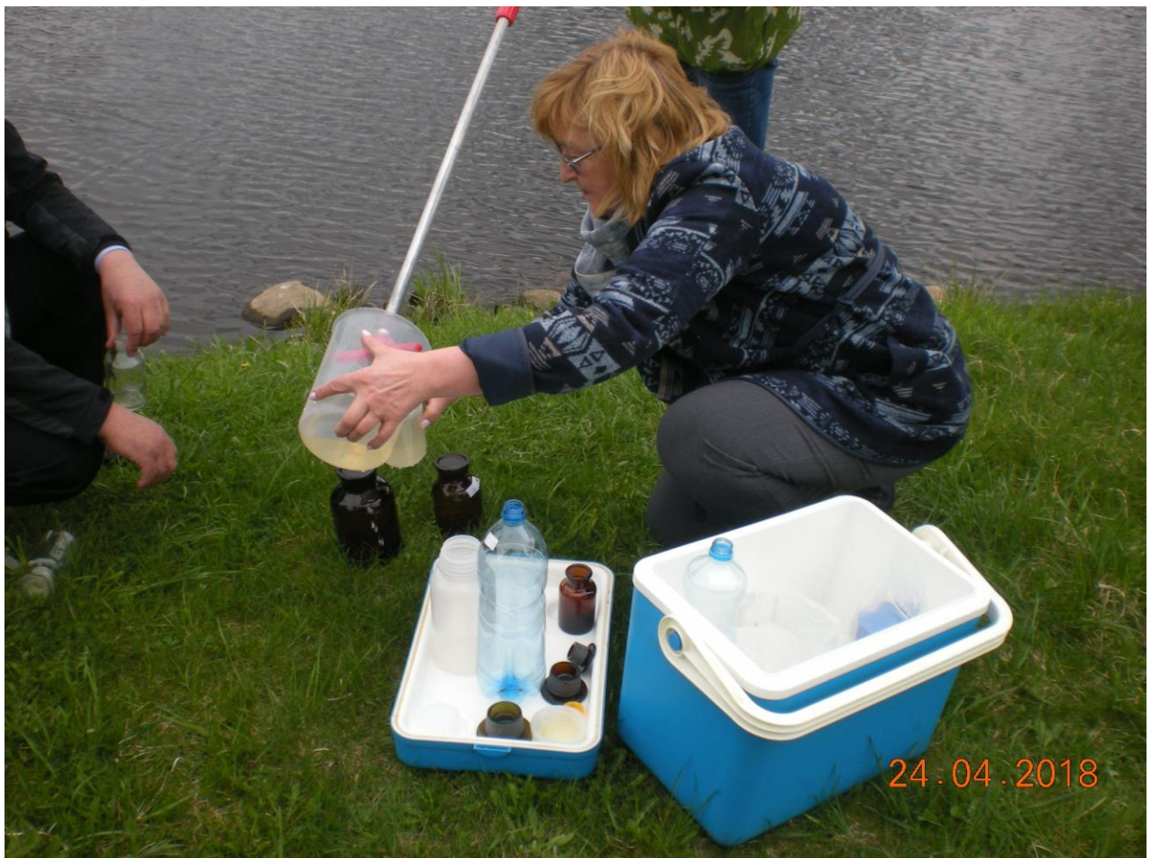
Fot. 2, 3. Pobór próbek wody z Czarnej Hańczy.