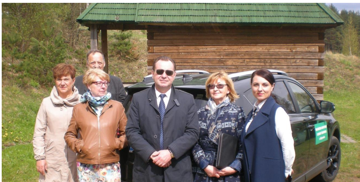
Fot. 1. Uczestnicy spotkania.

Celem spotkania było omówienie dalszej współpracy w dziedzinie monitoringu wód powierzchniowych i ochrony środowiska, wspólny pobór próbek wody z Czarnej Hańczy (Kanału Augustowskiego) w przekroju po stronie białoruskiej w m. Lesnaja, omówienie wyników badań z ostatniego wspólnego poboru próbek po stronie polskiej oraz wymiana dotychczasowych wyników badań Czarnej Hańczy.